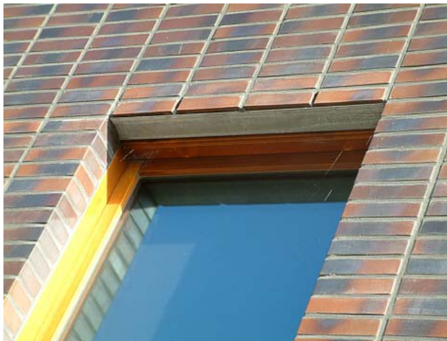
Figuur 2. Open stootvoegen boven kozijnopeningen voor uitwatering van spouwvocht en ventilatie.

Indien alleen open stootvoegen aan de onderzijde boven het maaiveld en boven (kozijn)openingen in het metselwerk worden aangebracht blijkt uit onderzoek de spouw in de praktijk droger dan bij de gebruikelijke ventilatieopeningen onder en boven. Het verdient daarom aanbeveling het aantal openingen beperkt te houden en onder dakranden en gevelopeningen weg te laten. Men spreekt in dit geval van het beluchten van de spouw. Het buitenblad en de spouw met overgangsweerstanden mogen dan worden meegerekend voor de bepaling van de totale warmteweerstand van de spouwconstructie.