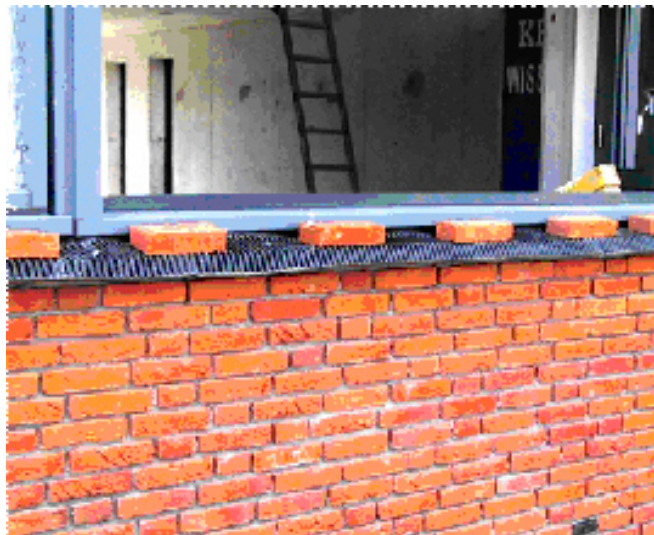
Figuur 3. Bij onderbreking van het metselen het metselwerk en de isolatie afdekken tegen inwateren.